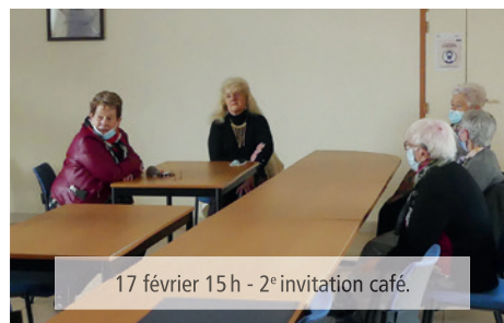
17 février 15 h - 2 e invitation café.

Le café se fait un peu attendre... Tous les sujets sont abordés, passés, présents et futurs.