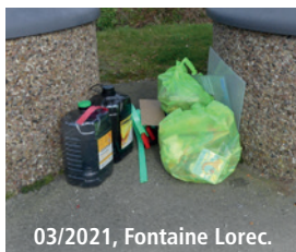
03/2021, Fontaine Lorec.