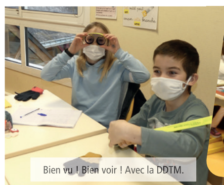
Bien vu ! Bien voir ! Avec la DDTM.

un jeu d'enfant pour des petites lucioles ! CM2, CM1, CE2, CE1 et CP, en tout, 92 brassards ont été fournis, dans le cadre de l'action nationale « Bien voir et être vu ! » soutenue par la Direction Départementale des Territoires et de la Mer .