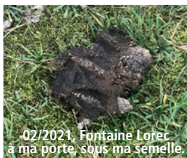
02/2021, Fontaine Lorec à ma porte, sous ma semelle.